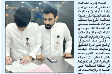
تحرير إحدى المخالفات

أعلنت إدارة العلاقات العامة في البلدية في قيام إدارة التفتيش ومتابعة خدمات البلدية بفرع بلدية محافظة الفروانية بتنفيذ جولات تفتيشية بمناطق المحافظة للتأكد من مدى التزام الأسواق والمحلات بشرط وضوابط البلدية، وفي هذا السياق، أوضح مدير إدارة التفتيش ومتابعة خدمات البلدية بمحافظة الفروانية بطلان العقاب التي تم تنفيذها في منطقة المحافظة على المحلات والإعلانات قد أسفرت عن تحرير 100 مخالفة شوكت ما بين عدم تجهيز المحلات بملابس النظافة، وإعلان تعريفه، إضافة إلى عدم ترخيص وإشغال مساحات وساحات من دون ترخيص من البلدية وعدم صيانتها.