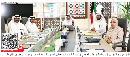
مريم بنديق: في خطوة جوهرية تعكس التزاماً حقيقياً بمبادئ الشفافية وتكافؤ الفرص، أقدمت وزارة الشؤون الاجتماعية على تنفيذ قرعة علنية تزييه وشفافة شملت المواطنين المتقدمين للتسابق في درجات الاختبار التحريري والمقابلات الشفهية، حيث جرى مراسم سحب بحضور ممثلي وسائل الإعلام، وممثلين عن الهيئة العامة للقوى العاملة واتحاد الجمعيات التعاونية.

وأشار العجمي إلى أن الأسماء النهائية سيتم إعلانها عبر الموقع الرسمي للوزارة، مؤكداً على أن معايير التقييم تشمل الكفاءة المهنية، بالإضافة إلى مهارات التواصل والتعامل مع العملاء، فضلاً عن القدرة على العمل تحت الضغط والتعاون مع الفرق.