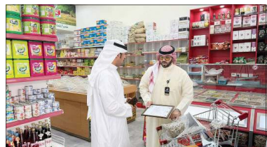
جانب من عملية التفتيش

متاحنا عبر تطبيق «انتساب» على الرقم: 20271120، وفق ما هو موضح في الفئات الرسمية، داعياً المهتمين إلى سرعة المبادرة بالتسجيل نظراً لحداوية المقاعد.